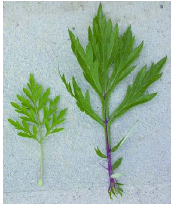
Foglia pagina superiore